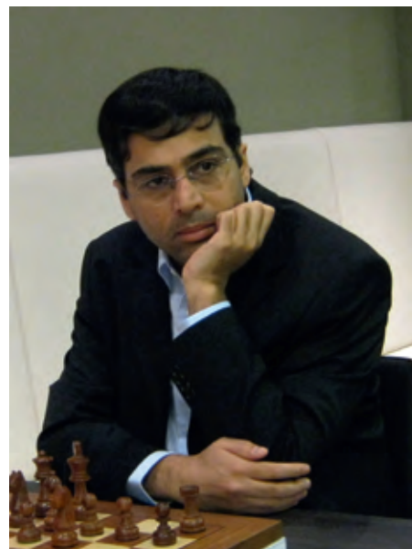
Turniersieger Viswanathan Anand